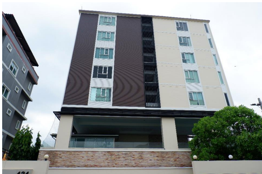
รูปที่ 1-2 สภาพปัจจุบันของโครงการ